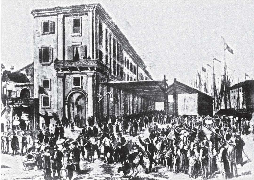
Senigallia, an der adriatischen Küste gelegen, war ein bedeutender Handelsplatz. Die regelmäßig stattfindende «Grande Fiera», die große Messe, spielte dabei eine wichtige Rolle.

der Bischofskirche eine wichtige Rolle spielte, waren die Mastai Ferretti. 11 Sie besaßen seit Ende des sechzehnten Jahrhunderts in Senigallia einen Palazzo und – wie es für eine halbwegs begüterte Familie üblich war – einige Kilometer entfernt in Roncitelli eine Villa auf dem Land. Die Mastai führten seit Beginn des achtzehnten Jahrhunderts den Grafentitel und gehörten damit zum italienischen Provinzadel. Vielleicht waren sie daher so peinlich darauf bedacht, ihre Rolle an der Spitze der gesellschaftlichen Pyramide der Stadt zu erhalten und gleichzeitig vom Freihandel finanziell zu profitieren, nach dem Motto: kirchlich und politisch streng konservativ, aber wirtschaftlich liberal.