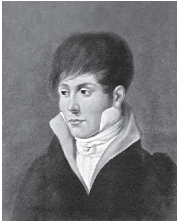
Der junge Graf Giovanni Maria Mastai Ferretti im Alter von achtzehn Jahren.

sichtig gewesen sein, sie in den vergangenen Monaten mit einigem Interesse angeschaut zu haben und ihr im Theater im Beisein der Mutter einige Besuche abgestattet zu haben. Aber genug davon, ich bin dem Sturme entkommen, und ich lege ein Gelübde ab, von jetzt an die Jungfern mit dem heiligen Auge des Eremiten anzuschauen. Ich muss das auch den verheirateten Frauen gegenüber tun, weil es notwendig ist, während es auf der Welt eine gibt, die mich allen anderen gegenüber gleichgültig macht.»