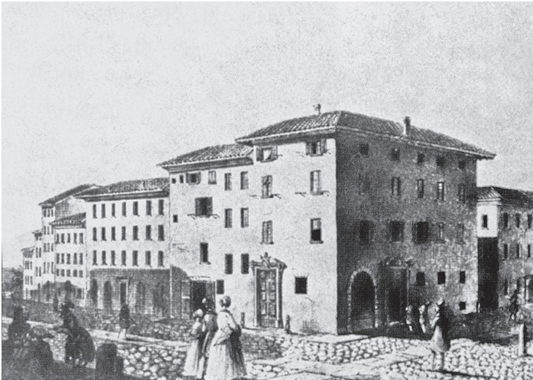
Die Familie Mastai Ferretti war eine der führenden Familien Senigallias und besaß hier seit Ende des sechzehnten Jahrhunderts einen Palazzo.